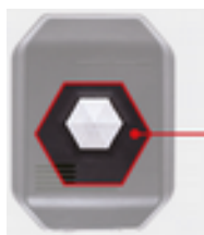
Pulsante per l'accettazione dell'allarme e della chiamata