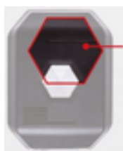
Microfono integrato e diodi luminosi

Il volume dell'altoparlante può essere regolato. Per fare questo, chiamate il nostro Hot-Line.