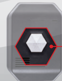
Taste für Notruf und Rufannahme