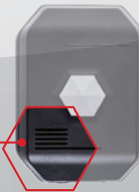
Integrierter Lautsprecher und Leuchtdiode