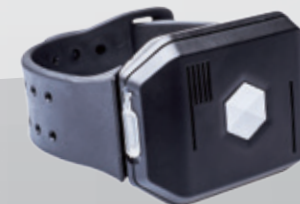
distyNotruf mit Armband